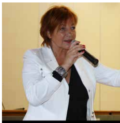
Veranstalterin: Elisabeth Hillebrand

Der Eintritt zur Veranstaltung ist frei, das Frühstück ist direkt vor Ort zu bezahlen. Aus Planungsgründen bittet die Veranstalterin um telefonische oder schriftliche Anmeldung (06642 250 oder hillebrand-mail@t-online.de) bis zum 12. März.